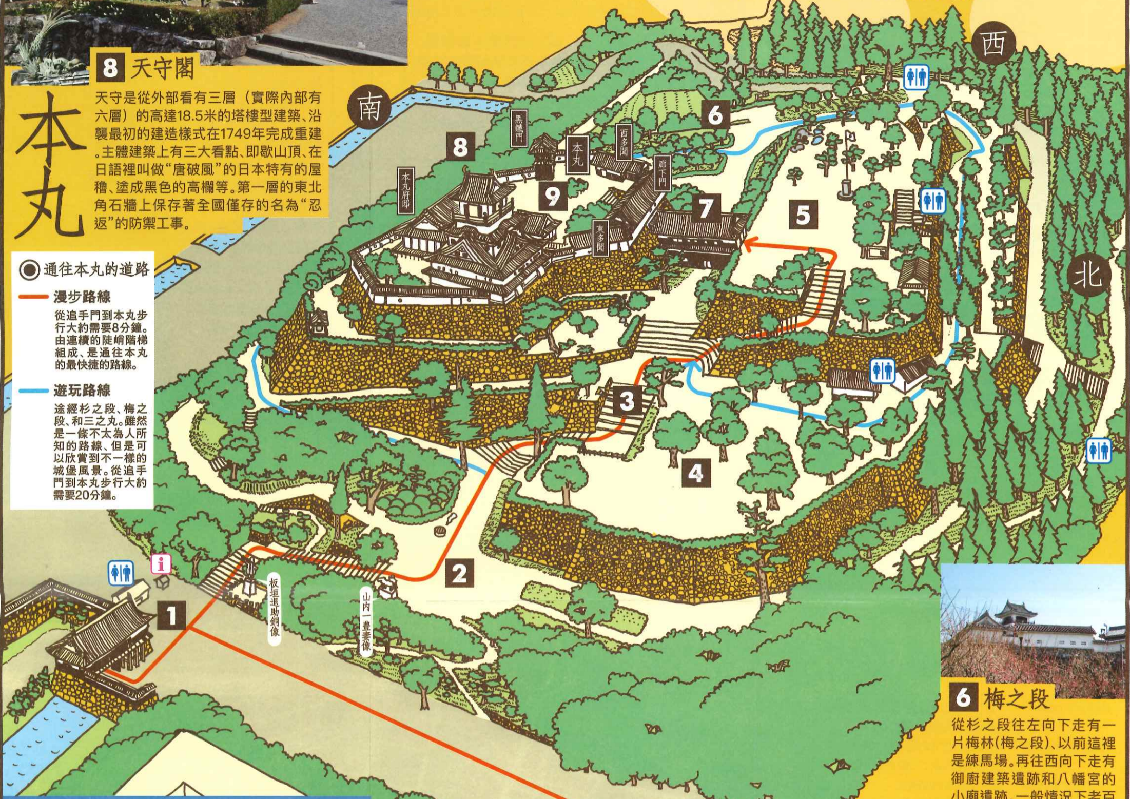
本丸御殿上段之間

本丸區域保留著天守閣、本丸府邸、納戶藏、廊下門、東多聞、西多聞、黑鐵門等建築物。在現存的十二座城堡中，只有高知城遺留著本丸府邸的建築物。上述的建築物都被指定為國家的重要文化遺產。東多聞是武器庫，西多聞是負責本丸警衛工作的武士的值班室，納戶藏是保管藩的重要文件的倉庫，黑鐵門則供藩主在舉行儀式時出入用。本丸府邸的書房由正殿、溜之間、玄關組成，正殿有名為“上段之間”的房間。這間房間是藩主專用的上座間，所以它的位置比普通房間高出一段。在“上段之間”的西側設有“武士密室”。藩主會客時全副武裝的武士守候在這間房間以防藩主遭受突然襲擊。格窗上雕刻有土佐波濤樣式的花紋。據說最初建造的府邸有鑲嵌金箔的隔門等奢侈品，但燒毀重建後的建築物則採用了樸素的風格。