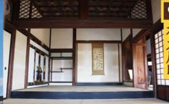
本丸府邸上段之间

途经杉之段、梅之段、和三之丸。虽然是一条不太为人所知的路线，但是可以欣赏到不一样的城堡风景。从追手门到本丸步行大约需要20分钟。