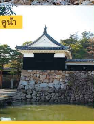
ป้อมปราการ