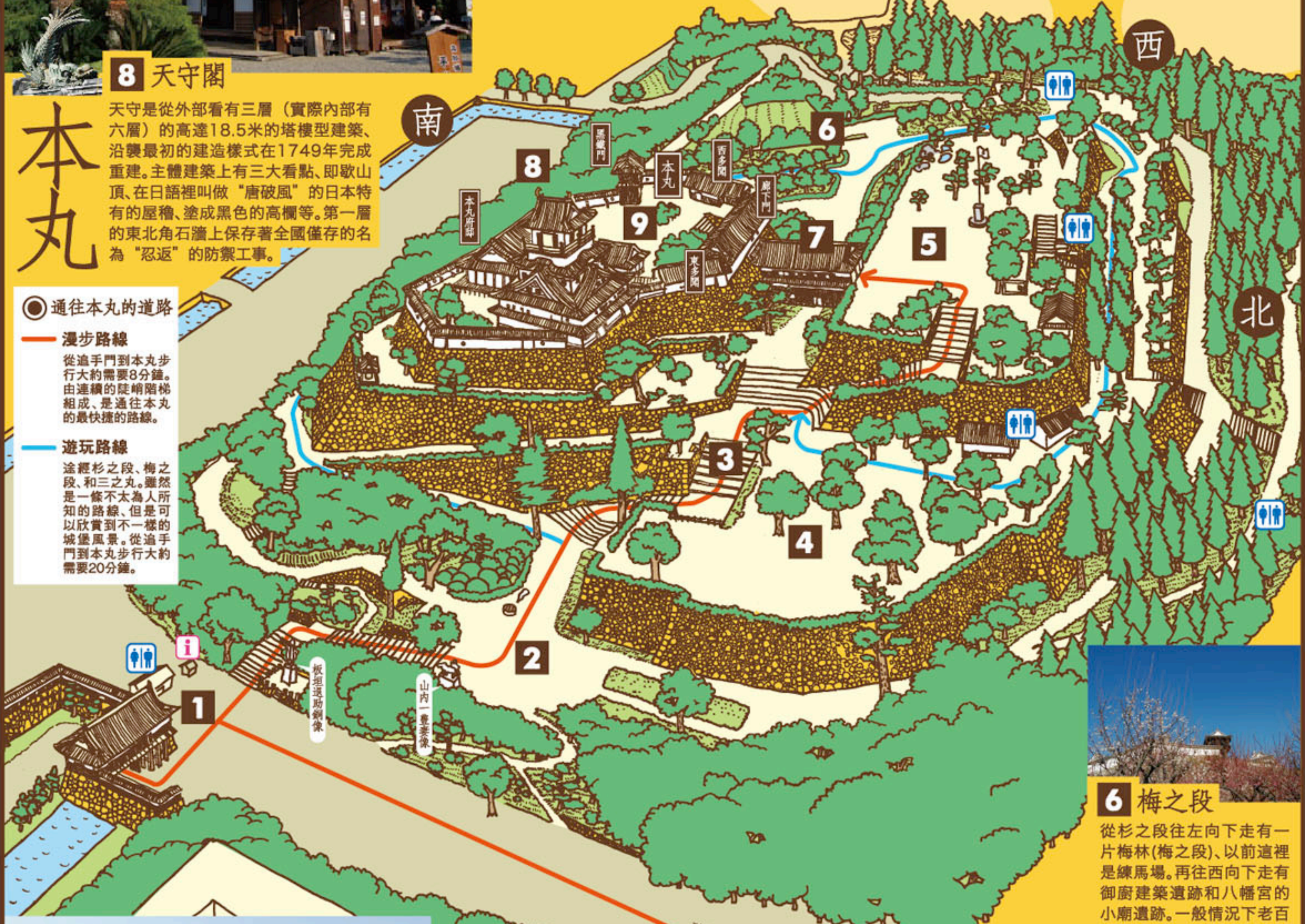
本丸御殿上段之間

本丸區域保留著天守閣、本丸府邸、納戶藏、廊下門、東多聞、西多聞、黑鐵門等建築物。在現存的十二座城堡中，只有高知城遺留著本丸府邸的建築物。上述的建築物都被指定為國家的重要文化遺產。東多聞是武器庫，西多聞是負責本丸警衛工作的武士的值班室、納戶藏是保管藩的重要文件的倉庫、黑鐵門則供藩主在舉行儀式時出入用。本丸府邸的書房由正殿、溜之間、玄關組成，正殿有名為“上段之間”的房間。這間房間是藩主專用的上座間。所以它的位置比普通房間高出一段。在“上段之間”的西側設有“武士密室”。藩主會客時全副武裝的武士守候在這間房間以防藩主遭受突然襲擊。格窗上雕刻有土佐波濤樣式的花紋。據說最初建造的府邸有鑲嵌金箔的隔門等奢侈品，但燒毀重建後的建築物則採用了樸素的風格。